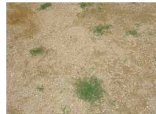
芝生植付(5月25日)の1ヶ月後(6月25日)の芝生育成状況